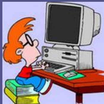
ИГРЫ НА КОМПЬЮТЕРЕ