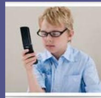
РАЗГОВОРЫ С ДРУЗЬЯМИ ПО ТЕЛЕФОНУ