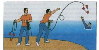
Подача конца Александра

Конец Александра нужно взять за большую петлю и сделать 2-3 витка веревки, малую петлю и оставшуюся веревку следует удерживать в другой руке. Сделав несколько замахов рукой с большой петлей, бросают конец Александра пострадавшему; тот в свою очередь должен надеть петлю через голову под руки или держать за поплавки. После этого пострадавшего подтягивают к берегу.